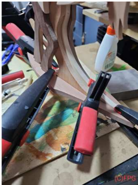
Bild: 3.9 Die Skulptur auf den Boden verleimen