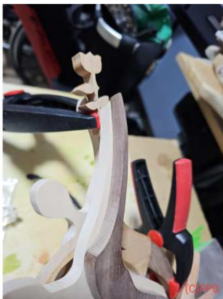
Bild: 3.10 Natürlich darf die Rose nicht fehlen