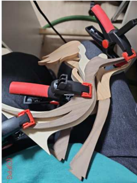
Bild: 3.8 Die letzte Ebene beginnen