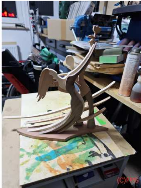
Bild: 3.11 Fertig ist das Tanzpaar noch nicht ganz...