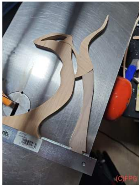
Bild: 3.1 Nur ein kleiner Millimeter etwas daneben, schon ist ein Spalt zwischen Bein und Oberkörper

Mit dem Zusammenbau habe ich erst mal "trocken" üben müssen. Jedes Teil hatte irgendwie eine Funktion für das nächste Teil und musste daher an die richtige Stelle verleimt werden. Auch musste ich besonders darauf achten, dass die Figur plan auf dem Boden steht. War schon ein arges Gefummel bis man es beieinander hatte. Und der Kasten Bier wurde immer leerer :(