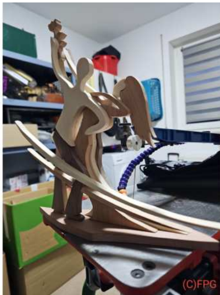
Bild: 3.12 ... es muss jetzt noch mit Öl eingelassen werden