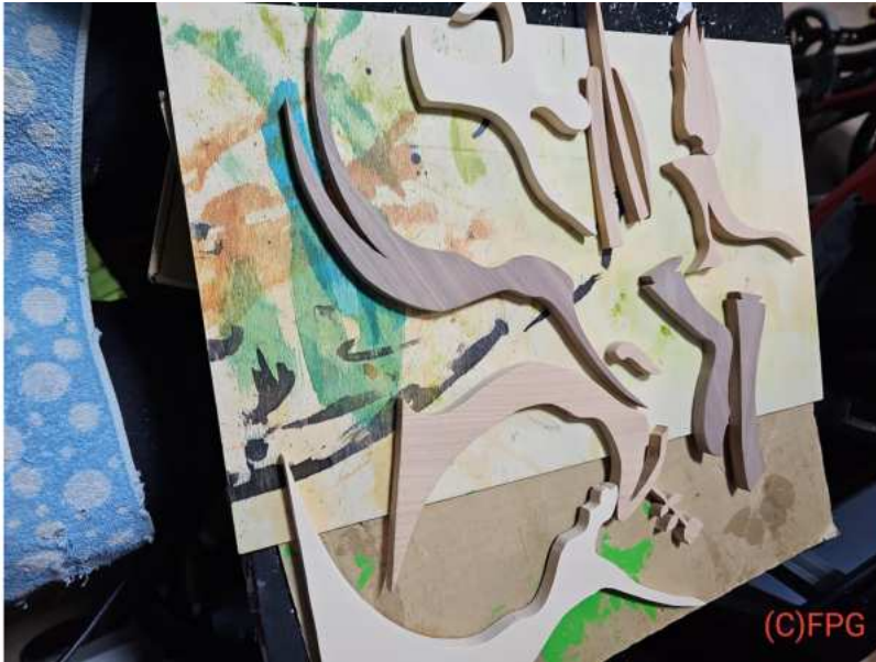
Bild: 2.4 alle Teile fertig verarbeitet