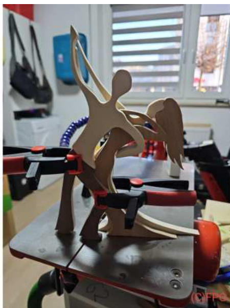
Bild: 3.7 Steht einwandfrei von alleine, G.s.D.