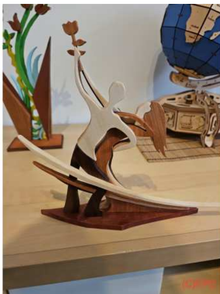
Bild: 4.3 ... ist man wieder glücklich und froh, was man gschafft hat erstellt mit BoschProjektDownload, Autor: kaosqlco