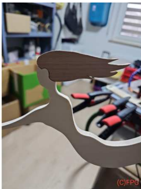
Bild: 3.4 Die Haare mit dem Kopf der Frau verleimt