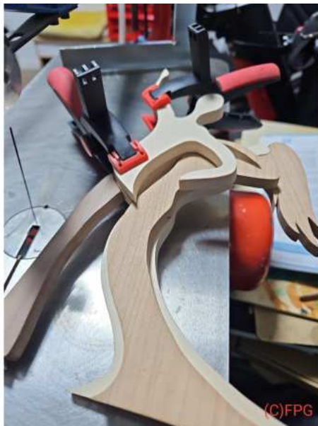
Bild: 3.6 Ansicht der Rückseite mit der Ergänzung der nächsten Ebene