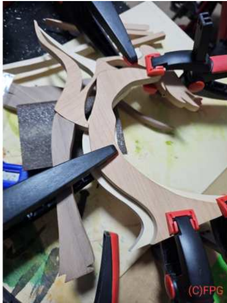
Bild: 3.5 Die nächste Ebene ebenfalls plan verleimt