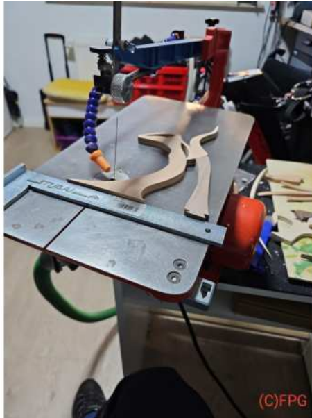
Bild: 3.2 Man muss wirklich exakt ausrichten...