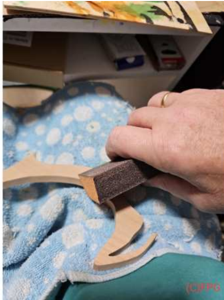
Bild: 2.1 vorsichtig mit der Hand schleifen