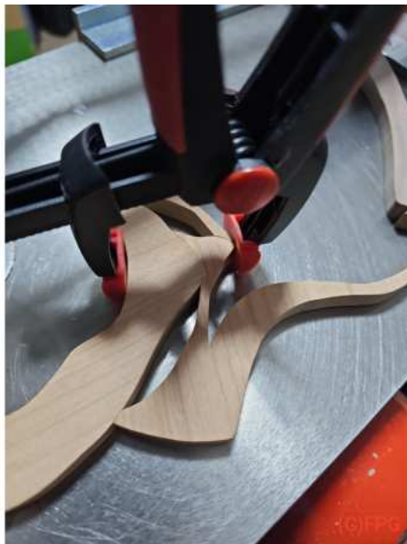
Bild: 3.3 ... und dann ohne zu verrutschen verleimen