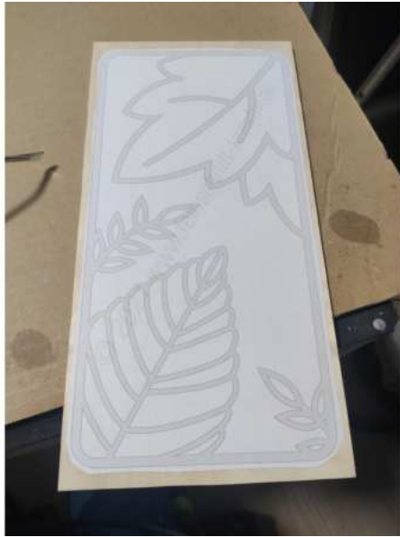
Bild: 2.1 Vorlage aufbringen

Auf die drei Sperrholzplatten habe ich die Vorlagen aufgeklebt, die Löcher für die Innenschnitte gebohrt und innen gesägt. Den Ausschnitt noch nicht sägen!