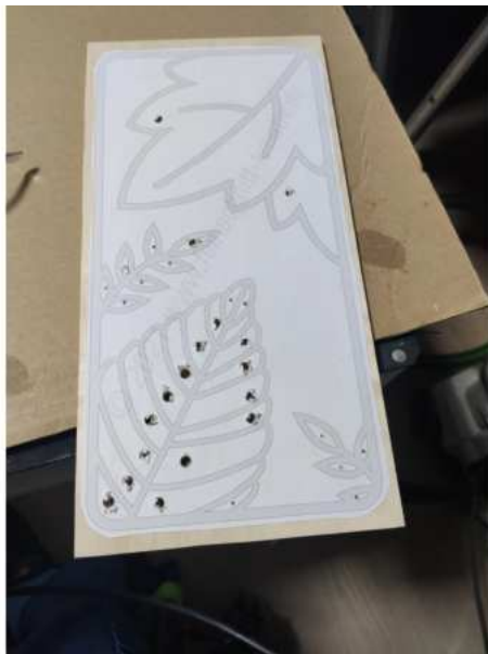
Bild: 2.2 Innenlöcher bohren